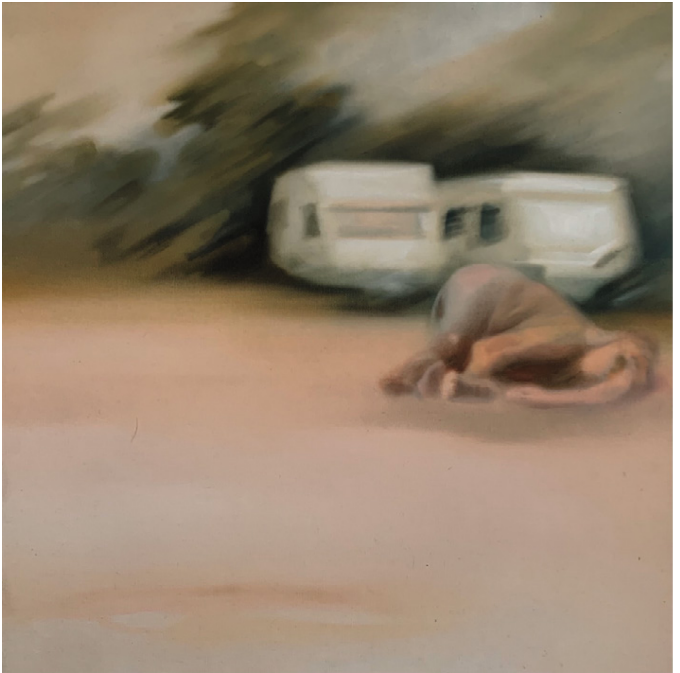
Werk Nr. 7