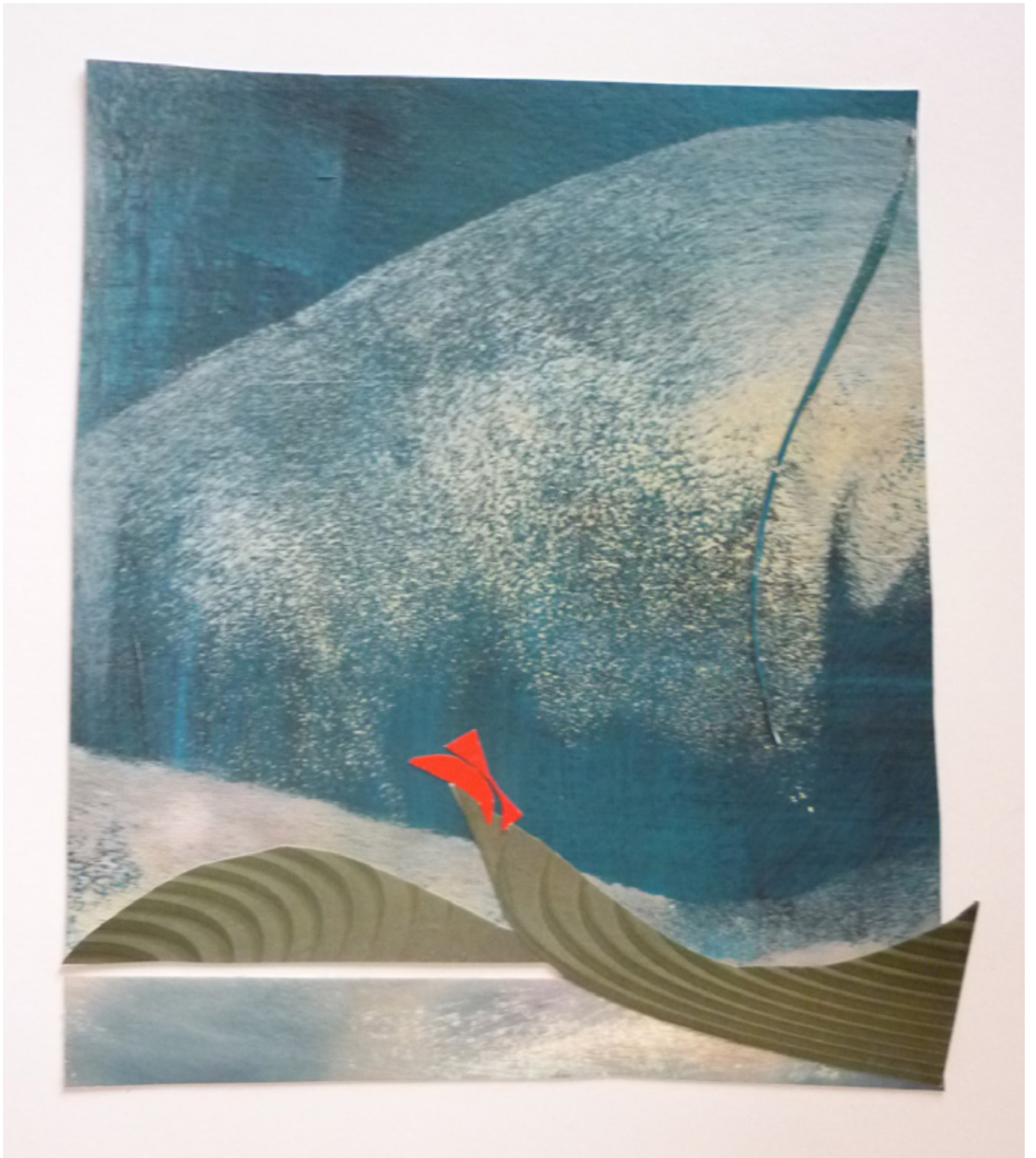
Werk Nr. 8