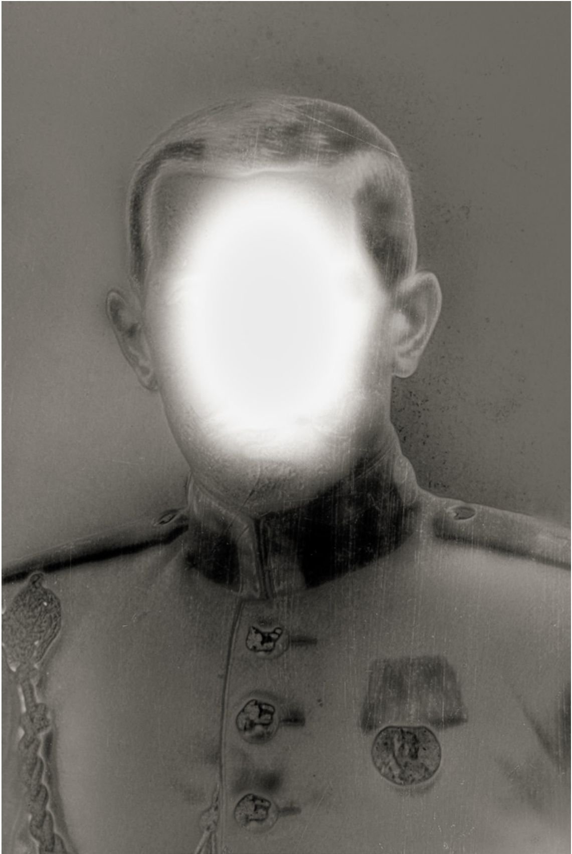
Werk Nr. 14