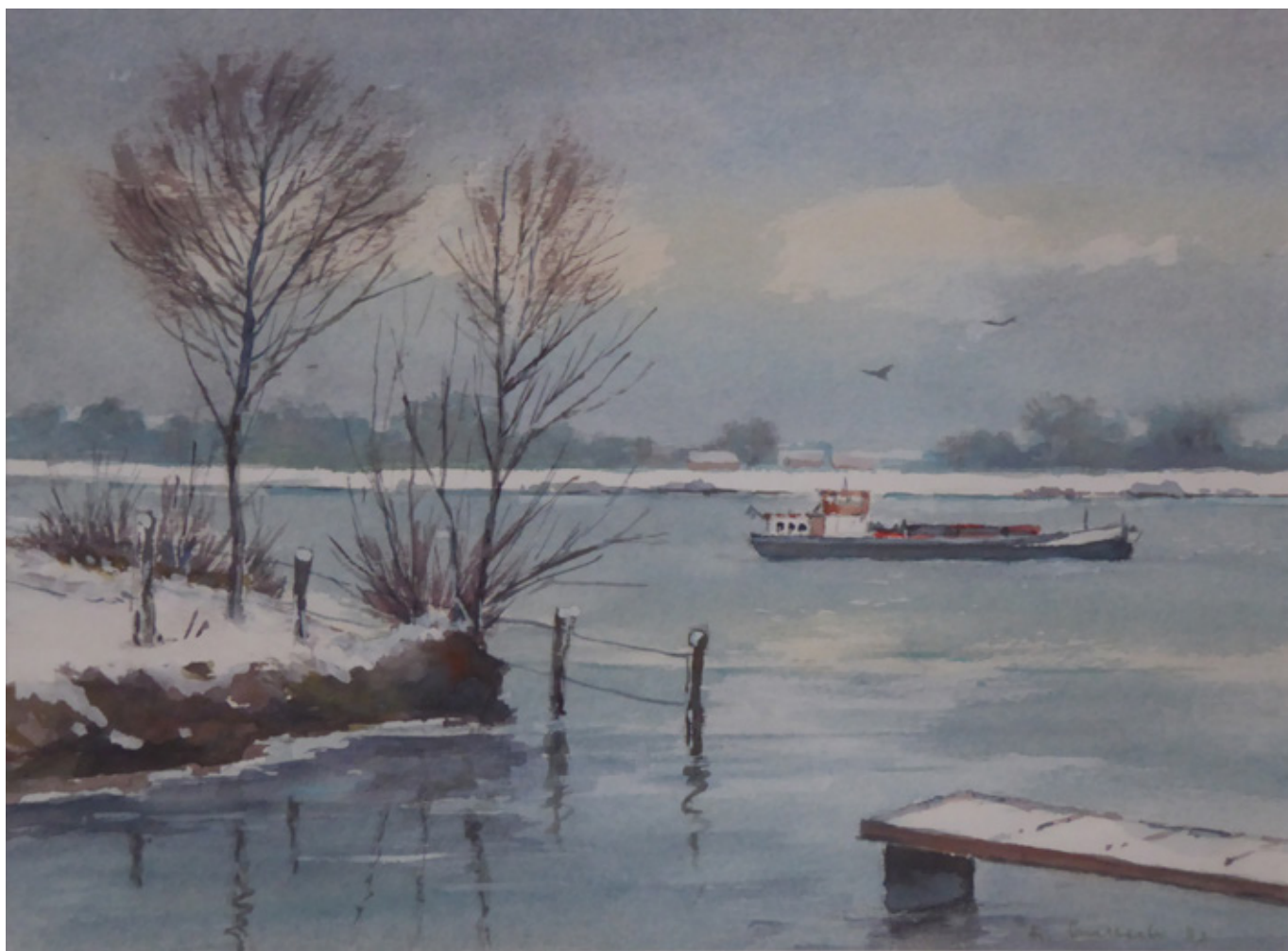
Werk Nr. 5