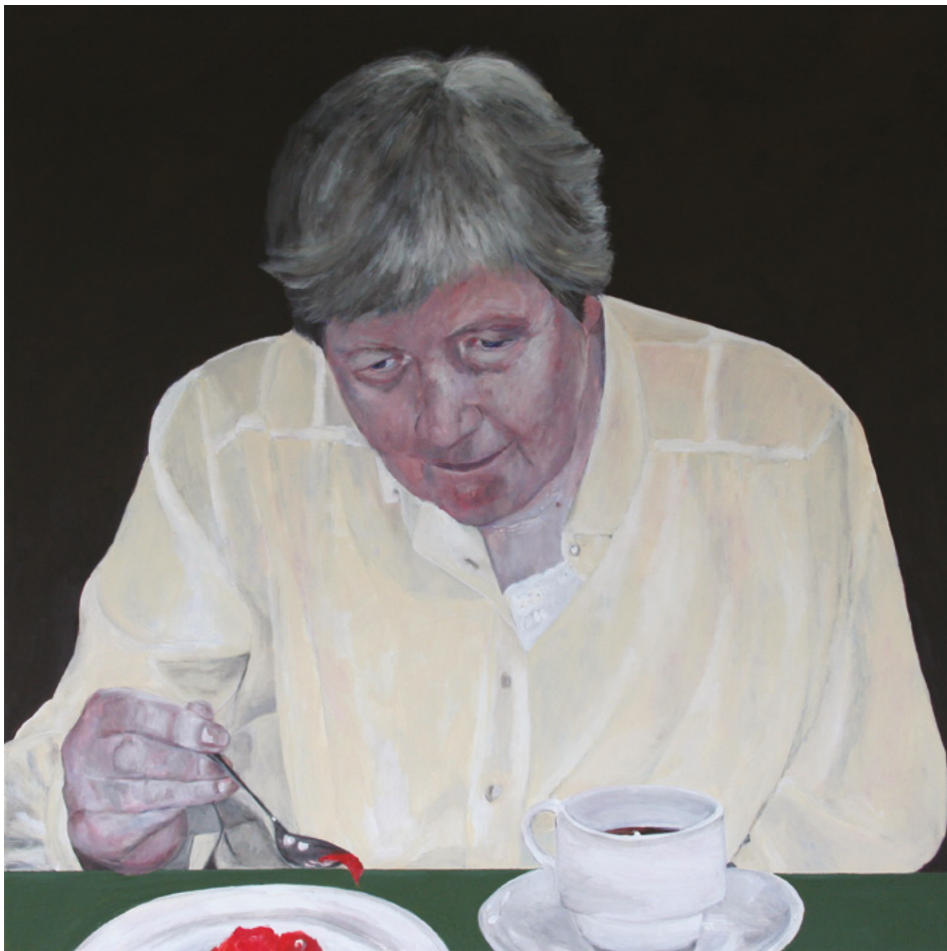
Werk Nr. 10