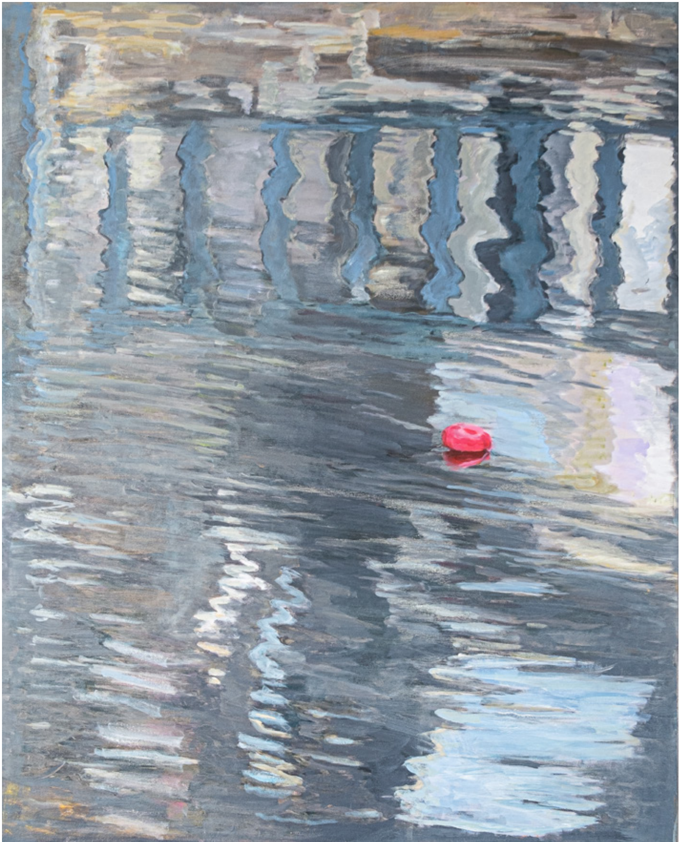
Werk Nr. 1