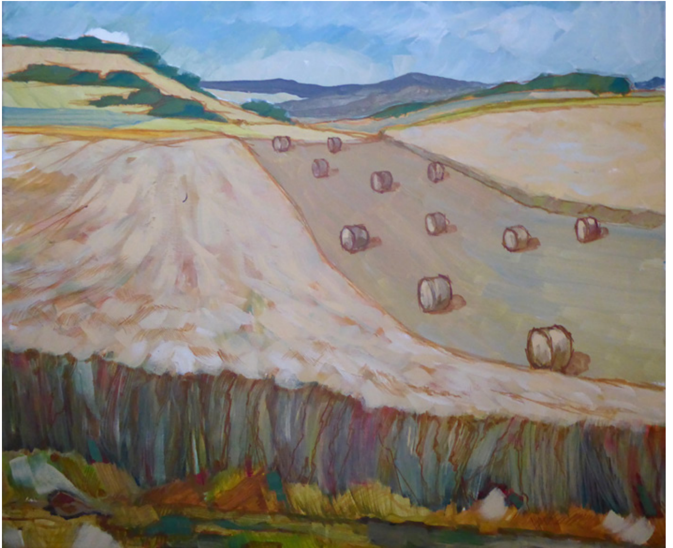
Werk Nr. 2