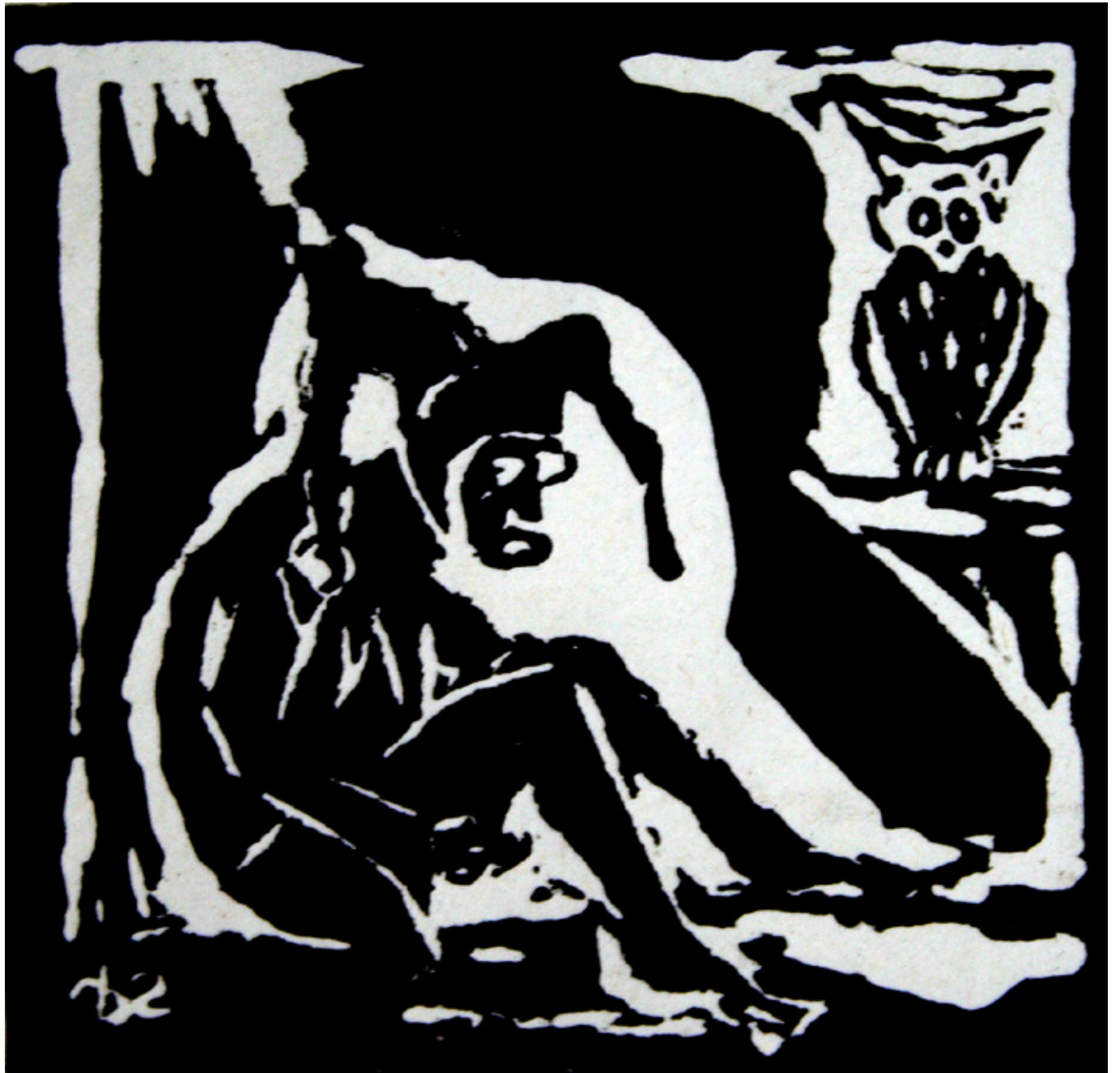
Werk Nr. 4