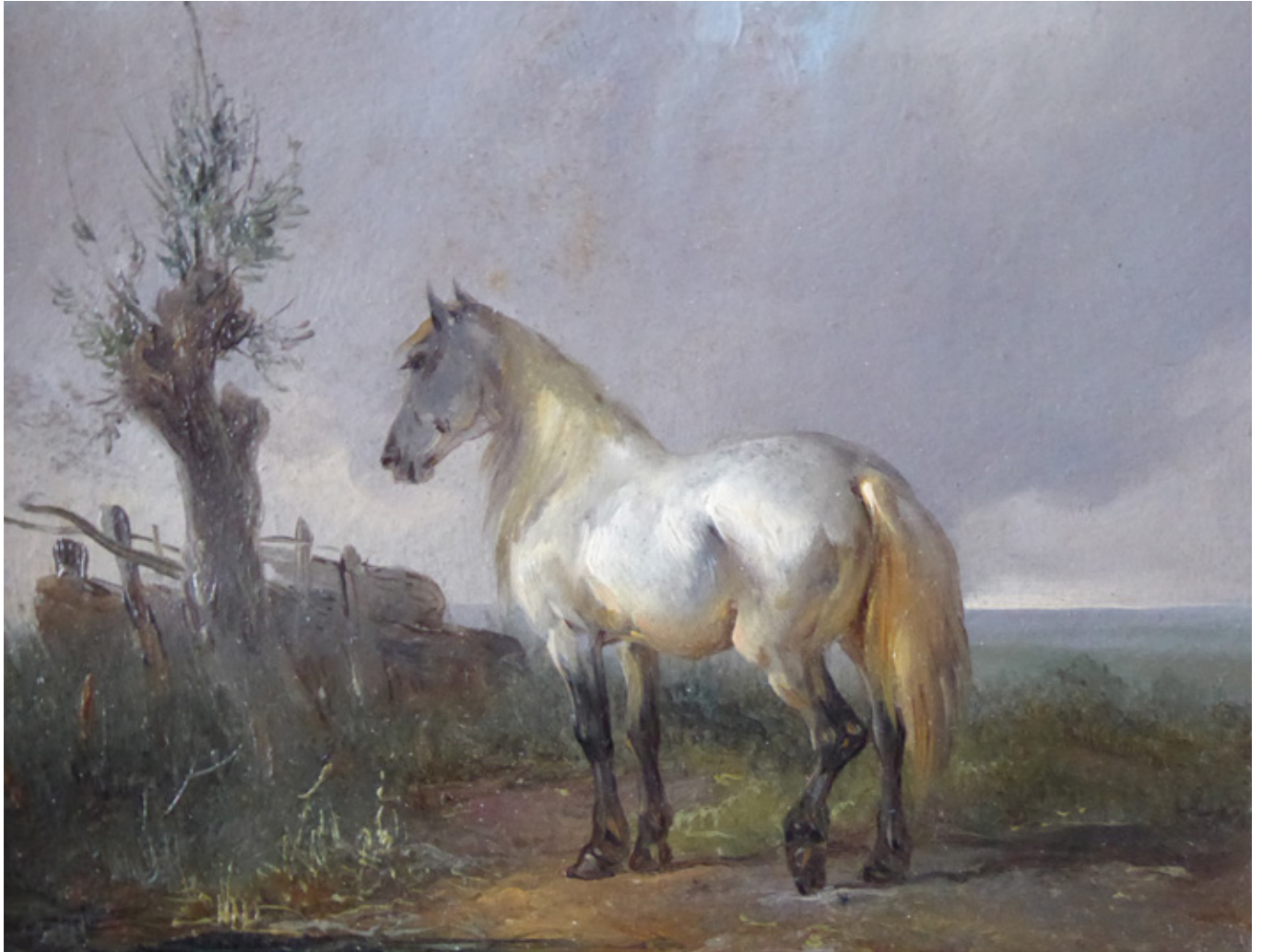
Werk Nr. 11