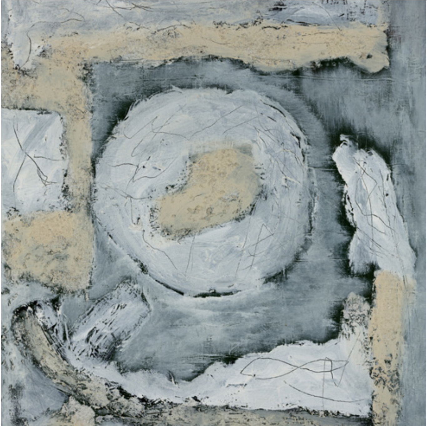
Werk Nr. 12